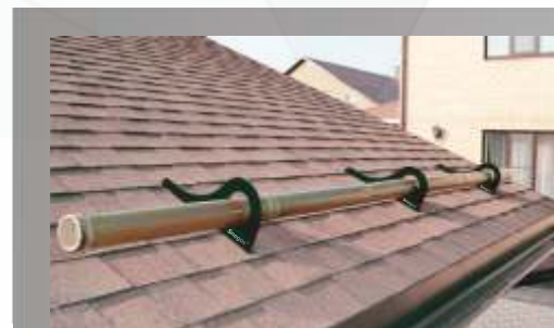
Гибкая черепица Снегозадержатель Бревно "БАМБУК", цвет "Натуральный"

Лучшие материалы, изысканный дизайн придают Snegos® Бревно особо ценное качество - индивидуальность.