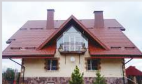
Металлочерепица Снегозадержатель Бревно "ПОЛИМЕР"