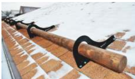
Гибкая черепица "Ruflex" Снегозадержатель Бревно "Эко", цвет "Палисандр"

Новый снегозадержатель умеет себя преподнести. Он подкупает дизайном и убеждает тщательно продуманной конструкцией. Будучи легче своих бревенчатых предшественников, он, как и прежде, готов к высоким нагрузкам.