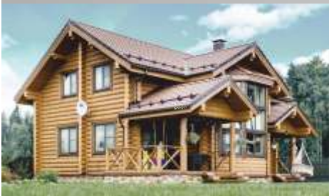
Натуральная черепица Снегозадержатель Бревно "ПОЛИМЕР"