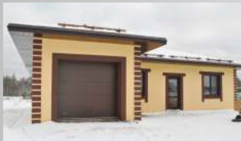
Гибкая черепица "Döcke" Снегозадержатель Бревно "ЭКО", цвет "Ореховое дерево"